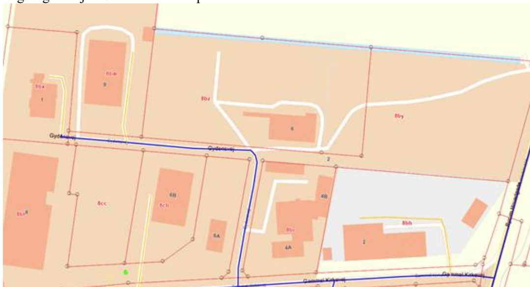
Tegning 2: forslag til ændring af vejforløb