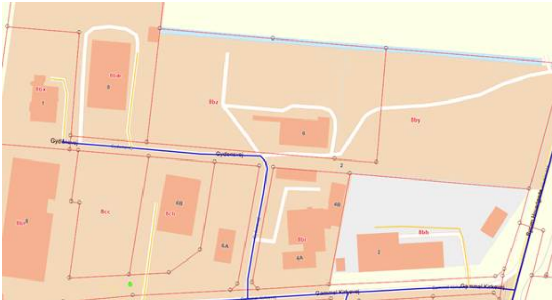
Tegning 2: forslag til ændring af vejforløb